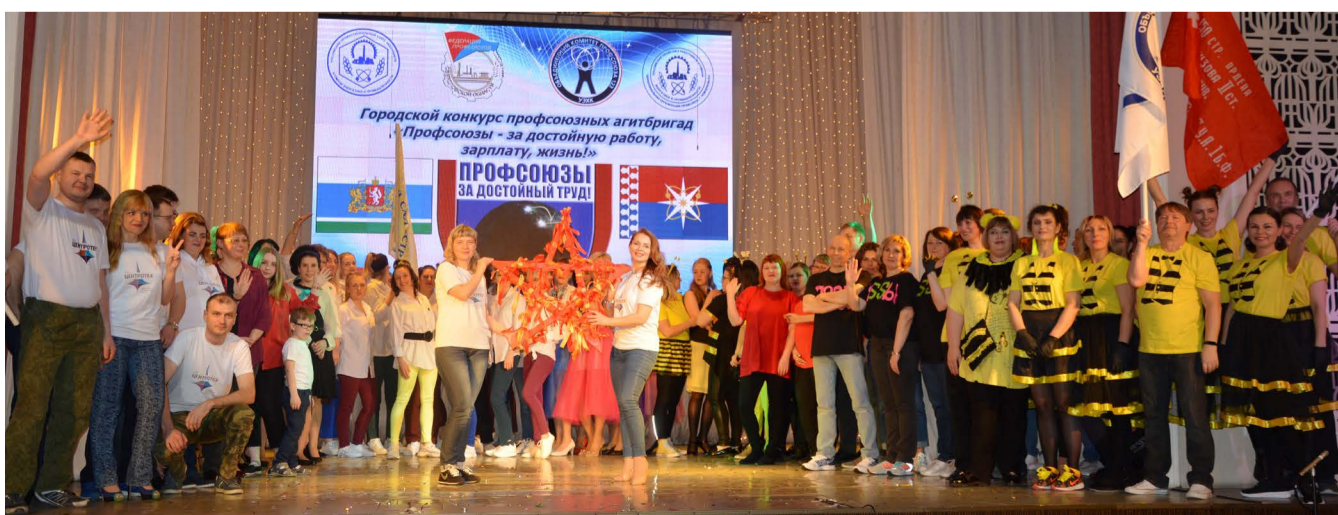
Больше фото с конкурса агитбригад – на www.okp-123.pf