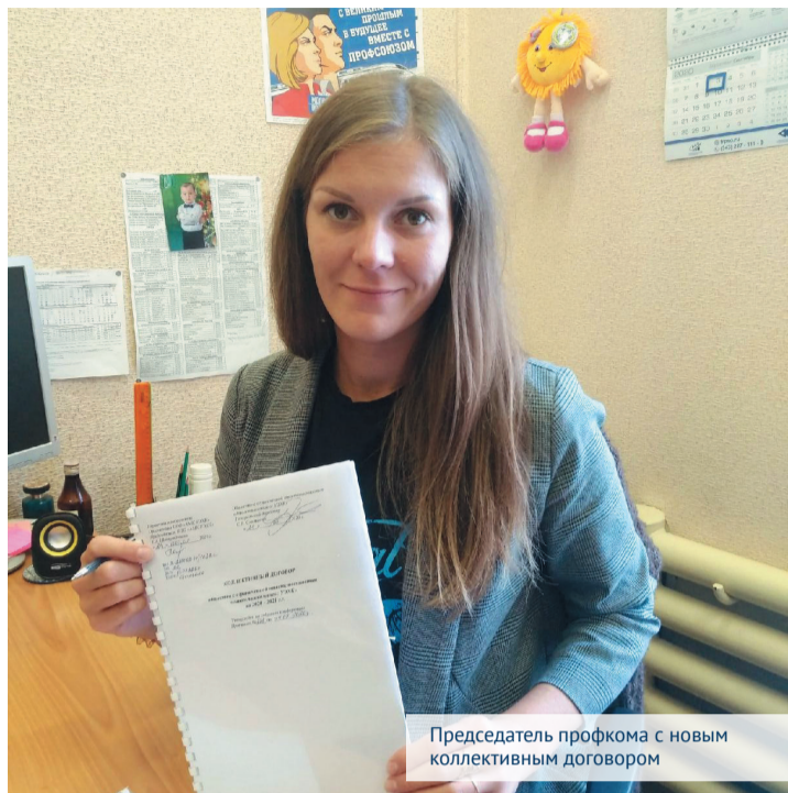
Председатель профкома с новым коллективным договором