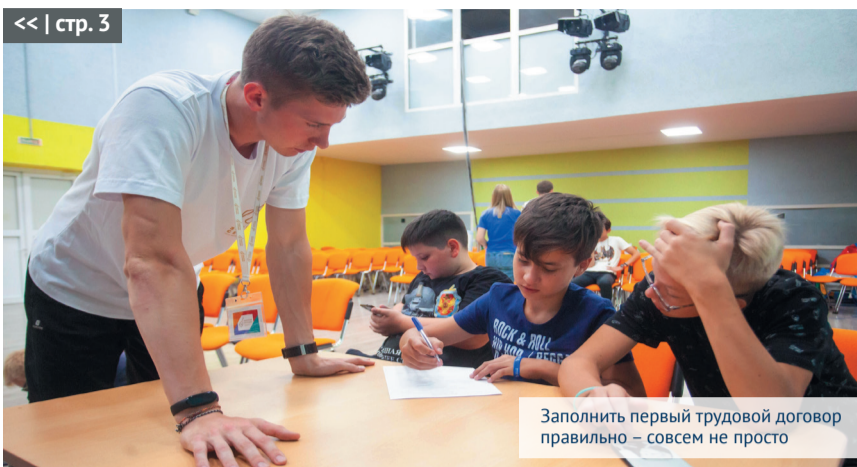
Заполнить первый трудовой договор правильно – совсем не просто

Объединённый комитет профсоюза № 123 в условиях нескольких переносов даты открытия оздоровительного центра, оперативно согласовал графики выездов, провёл сбор заявок и выдачу путёвок, разработал пакет документов для родителей, приобрёл дополнительный спортивный инвентарь для ребят, провёл входной медицинский осмотр детей в день заезда и выезда, их доставку до лагеря и обратно.