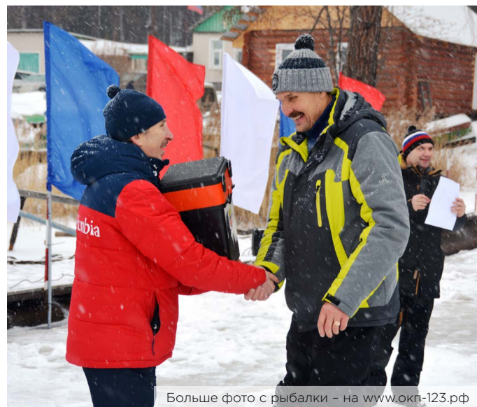
Больше фото с рыбалки – на www.okp-123.pф