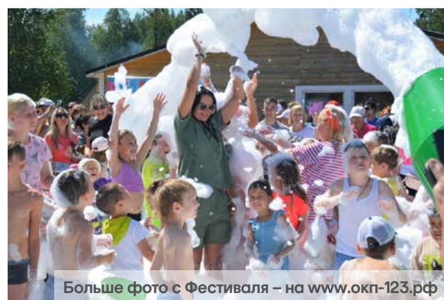
Больше фото с Фестиваля – на www.okp-123.rf

Участники не только сотворили кулинарное чудо, накормив дымящимися шашлыками, овощами гриль, разнообразными канапе, бургерами и закусками, прохладительными лимонадами и десертами всех гостей праздника, но и креативно подошли к презентации гостям и судьям своих творений. «Брауни банан гриль», «Медвежий стейки»,