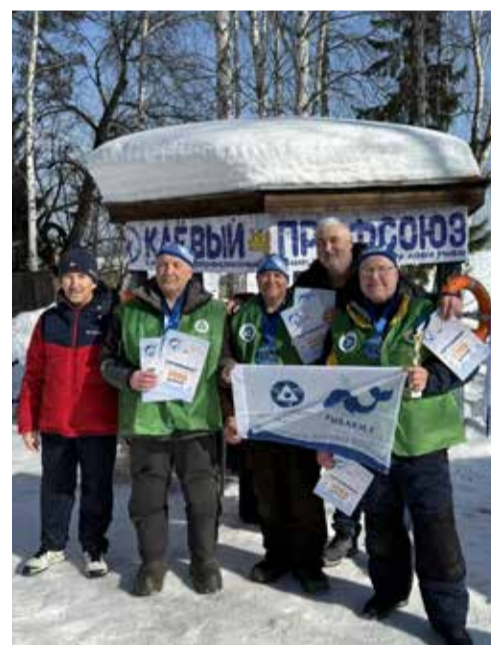
Команда «РыбаКит» (Центротех):

Спасибо организаторам за такой прекрасный праздник, а также судейской коллегии, которая оценивает всегда беспристрастно. Всем здоровья, никогда не оставляйте рыбалку на последний план!